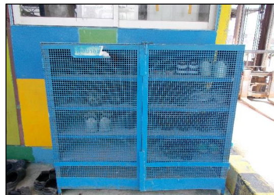
ภาพที่ 15 ตู้เก็บอุปกรณ์ป้องกันอันตรายส่วนบุคคล