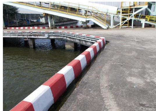
ภาพที่ 5 รางระบายน้ำบริเวณท่าเทียบเรือ