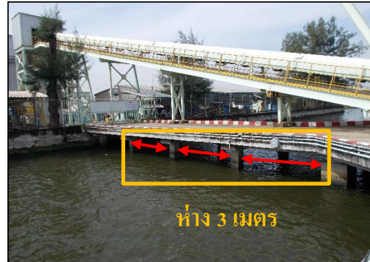
ภาพที่ 12 การออกแบบและก่อสร้างท่าเทียบเรือ ให้มีช่องว่างระหว่างเสาไม่น้อยกว่า 3 เมตร