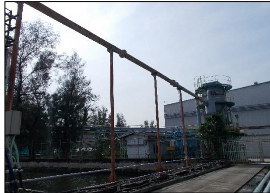
ภาพที่ 2 ระบบท่อลำเลียงแบบปิด