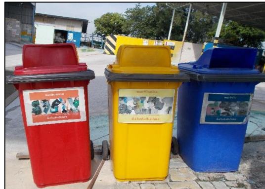
ภาพที่ 4 ถังรองรับมูลฝอยแบบแยกประเภท