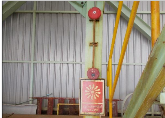
ภาพที่ 16 สัญญาณเตือนภัย บริเวณท่าเทียบเรือ