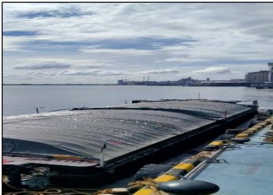
ภาพที่ 3 ผ้าใบปิดคลุมเรือขนส่งอย่างปิดชิด