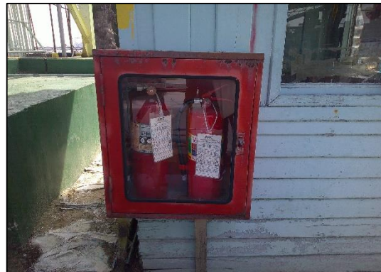
ภาพที่ 17 การจัดเตรียมถังดับเพลิง บริเวณท่าเทียบเรือ