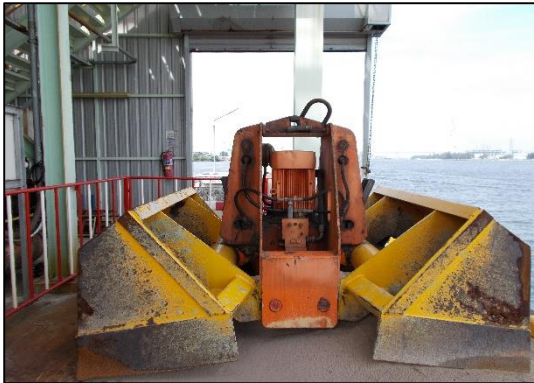
ภาพที่ 1 การจัดให้มีกระเช้าขึ้นจั่น